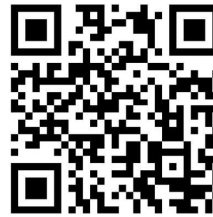
สแกนเพื่อสมัคร

ทั้งนี้ ผู้สมัครต้องกรอกรายละเอียดต่าง ๆ ในการสมัครให้ถูกต้องและครบถ้วน กรณีมีความผิดพลาดเกิดจากผู้สมัคร หรือทางมหาวิทยาลัยตรวจสอบในภายหลังแล้ว พบว่าเอกสารและหลักฐานไม่ตรงตามประกาศรับสมัคร ให้ถือว่าขาดคุณสมบัติที่จะบรรจุและแต่งตั้งตั้งแต่ต้น และไม่คืนค่าธรรมเนียมการสมัครสอบ