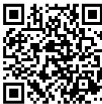
QR ลงทะเบียน (สงวนสิทธิ์สำหรับผู้ลงทะเบียน