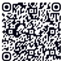
ดาวน์โหลดใบสมัคร

ผู้ประสงค์จะเข้ารับการคัดเลือกยื่นใบสมัครได้ที่ลิงก์ https://forms.gle/xkhvQQPxSCDWZFHG7 หรือสแกน QR Code ตามที่ปรากฏ ตั้งแต่บัดนี้เป็นต้นไป จนถึงวันที่ ๗ พฤศจิกายน พ.ศ. ๒๕๖๘ (ไม่เกินเวลา ๑๖.๓๐ น.) หรือสอบถามรายละเอียดได้ที่หมายเลขโทรศัพท์ ๐ ๓๘๑๐ ๒๔๙๕ ในวันและเวลาราชการ