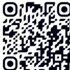
สแกนเพื่อสมัคร

ทั้งนี้ ผู้สมัครต้องกรอกรายละเอียดต่าง ๆ ในการสมัครให้ถูกต้องและครบถ้วน กรณีมีความผิดพลาดเกิดจากผู้สมัคร หรือทางมหาวิทยาลัยตรวจสอบในภายหลังแล้ว พบว่าเอกสารและหลักฐานไม่ตรงตามประกาศรับสมัคร ให้ถือว่าขาดคุณสมบัติที่จะบรรจุและแต่งตั้งตั้งแต่ต้น และไม่คืนค่าธรรมเนียมการสมัครสอบ