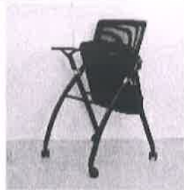
เก้าอี้เ้ก้คเจอร์ • มีล้อเลื่อน • สามารถกนสามารถวางกรงเบ้ากด์ • เบาะรองนั่งสามารถเส้กสไฟได้