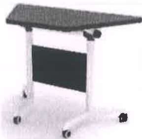
โต๊ะทรงสี่เหลี่ยมแบบหมุน • มีล้อเลื่อน • สามารถพับเก็บได้ • พนักพิงสามารถเส้กสไฟได้